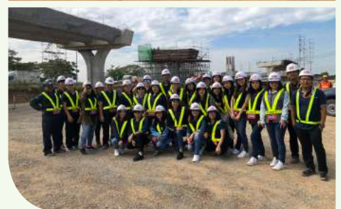
Motorway ช่วง 1, 2