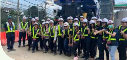
รถไฟฟ้าสายสีชมพู-สีเหลือง