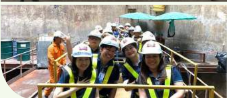
อุโมงค์ระบายน้ำบึงหนองบอน