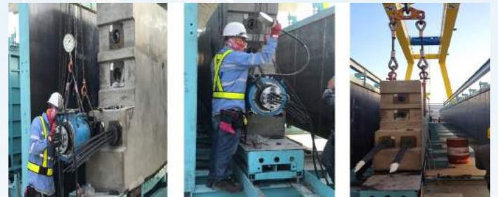
รูป 4 การดึงลวดอัดแรงก่อนยกเข้า Stock Yard

Prestressed effect และก่อนที่จะทำการขนส่งเพื่อนำออกไปติดตั้งจริงก็จะทำการดึงลวดจริงอีกครั้งก่อนยกขึ้นรถเพื่อขนส่งไปสู่นำงาน สำหรับพื้นที่จัดเก็บที่เตรียมไว้ก็สามารถที่จะ stock ตัว Guideway Beam ได้ประมาณ 2,000 ตัว