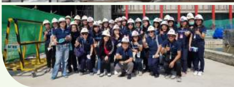
อาคารรัฐสภาแห่งใหม่