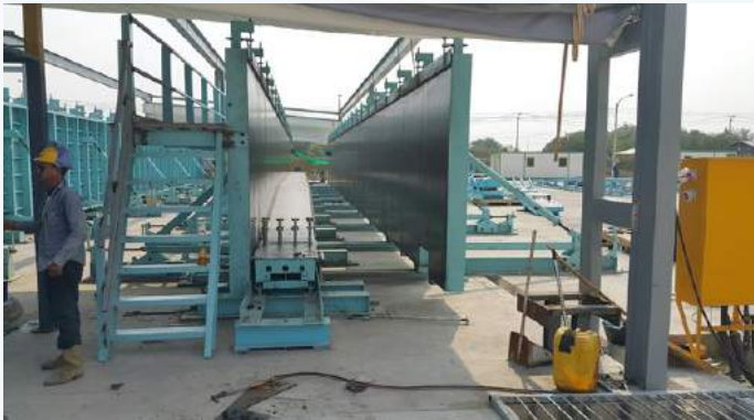
รูป 2 แสดงการเตรียมแบบหล่อ Guideway Beam

ภายในโรงงานมี Concrete Plant ที่มีกำลังผลิตอยู่ที่ 500m 3 ต่อวัน โดยที่คาน Guideway Beam 1 ตัวใช้คอนกรีตประมาณ 34 m 3 ที่กำลังเท่ากับ 45MPa สำหรับคานตรงและ 60MPa สำหรับคานโค้ง โดยในโรงงานจะมีแบบหล่อคานตรง จำนวน 10 ชุด และแบบหล่อคานโค้งจำนวน 8 ชุด