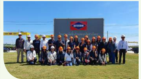
โรงหล่อ จ.นนทบุรี