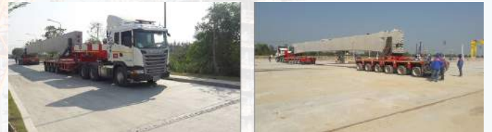
รูป 6 รถขนส่ง Guideway Beam

สำหรับการขนส่ง Guideway Beam จากโรงหล่อไปเพื่อติดตั้งที่หน้างานจะต้องมีการจัดเตรียมรถเทรลเลอร์พิเศษสำหรับขนส่งเพื่อป้องกันน้ำหนักลงเพลาไม่ให้เกินตามที่กฎหมายกำหนดไว้ ซึ่งจะต้องเตรียม โครงสร้างชั่วคราวที่สามารถ Lock ตัวคานให้อยู่กับรถขนส่งโดยไม่เกิดความเสียหาย