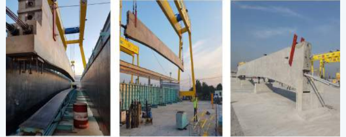
รูป 5 stock Guideway Beam

สำหรับการขนส่ง Guideway Beam จากโรงหล่อไปเพื่อติดตั้งที่หน้างานจะต้องมีการจัดเตรียมรถเทรลเลอร์พิเศษสำหรับขนส่งเพื่อป้องกันน้ำหนักลงเพลาไม่ให้เกินตามที่กฎหมายกำหนดไว้ ซึ่งจะต้องเตรียม โครงสร้างชั่วคราวที่สามารถ Lock ตัวคานให้อยู่กับรถขนส่งโดยไม่เกิดความเสียหาย