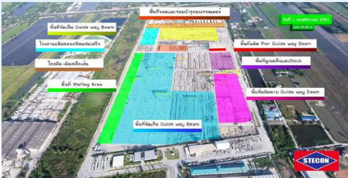
รูป 1 แสดง Casting Yard Layout สำหรับผลิต Guideway Beam

สำหรับโรงงานผลิตชิ้นส่วนคอนกรีตสำเร็จรูป (STECON Casting Yard) เรียกได้ว่าเป็นหัวใจหลักของโครงการ ซึ่งใช้เป็นศูนย์กลางในการผลิตคานรองรับทางวิ่ง (Guideway Beam) สำหรับทั้งรถไฟฟ้าสายสีชมพู และรถไฟฟ้าสายสีเหลือง ซึ่งดัดแปลงพื้นที่มาจากโรงหล่อ Precast Segmental Box Girder ของ STECON ระยะเวลาในการออกแบบภาพรวมของโรงงานและสิ่งอำนวยความสะดวกต่างๆ รวมถึงก่อสร้างใช้เวลาอยู่โดยประมาณ 9 เดือนจากนั้นก็เริ่มติดตั้งแบบหล่อ Guideway Beam ที่เป็นคานตรง และแบบหล่อ Guideway Beam ที่เป็นคานโค้ง รวมถึง แบบหล่อ Pier Segment ด้วย ซึ่งกำลังการผลิตสูงสุดของโรงงานอยู่ที่ 1 วันต่อ 1 แบบหล่อ สำหรับคานตรง และ 2 วันต่อ 1 แบบหล่อ สำหรับคานโค้ง