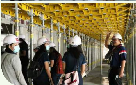
อาคาร RASA ถ.เพชรบุรี