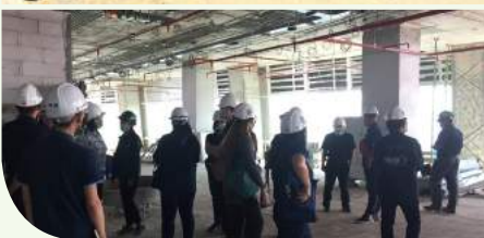
สำนักงานประมาณ