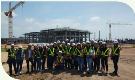
Gulf National Golf Course Project จ.ปทุมธานี