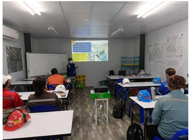
การอบรมด้านความปลอดภัยและอาชีวอนามัยให้กับผู้ปฏิบัติงานที่เข้าทำงานใหม่ภายในหน่วยงานก่อสร้าง