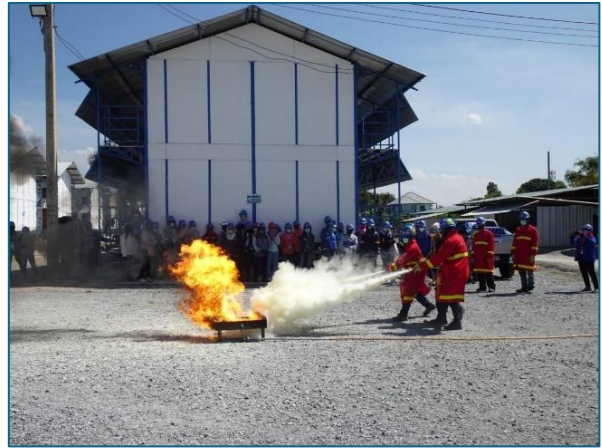
การฝึกซ้อมดับเพลิงและการอพยพหนีไฟ