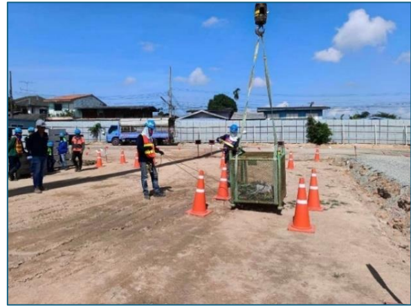
การอบรมหลักสูตร “ผู้ควบคุมการใช้ปั้นจั่น ผู้ให้สัญญาณแก่ผู้บังคับปั้นจั่น และผู้ยึดเกาะวัสดุ”