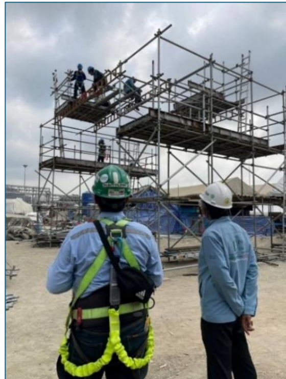
การอบรมหลักสูตร “ผู้ควบคุมติดตั้งและผู้ตรวจสอบนั่งร้าน”