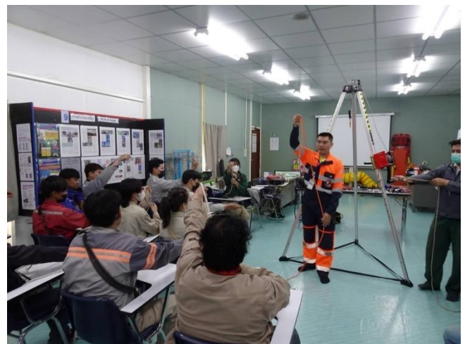
การอบรมหลักสูตร “ความปลอดภัยในการทำงานในที่อับอากาศ”